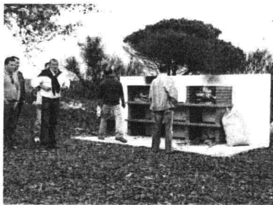
Febras já assam na brasa